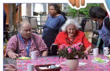
8 Koffie voor Geluk bij De Leeuwenhoek