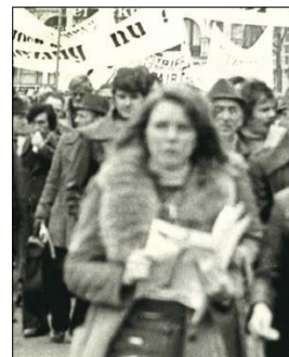
7 Iedereen kan verhalen vertellen