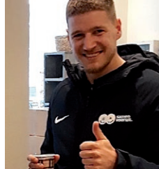
Hart voor elkaar

Het coronavirus DE BUURT STAAT ACHTER JE!