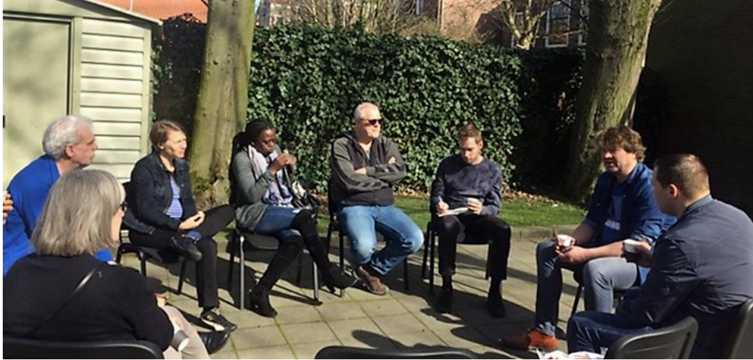
De werkgroep Pand samen met belangstellende bewoners op bezoek in Delft bij een soortgelijke ontwikkeling om van elkaars praktijken te kunnen leren