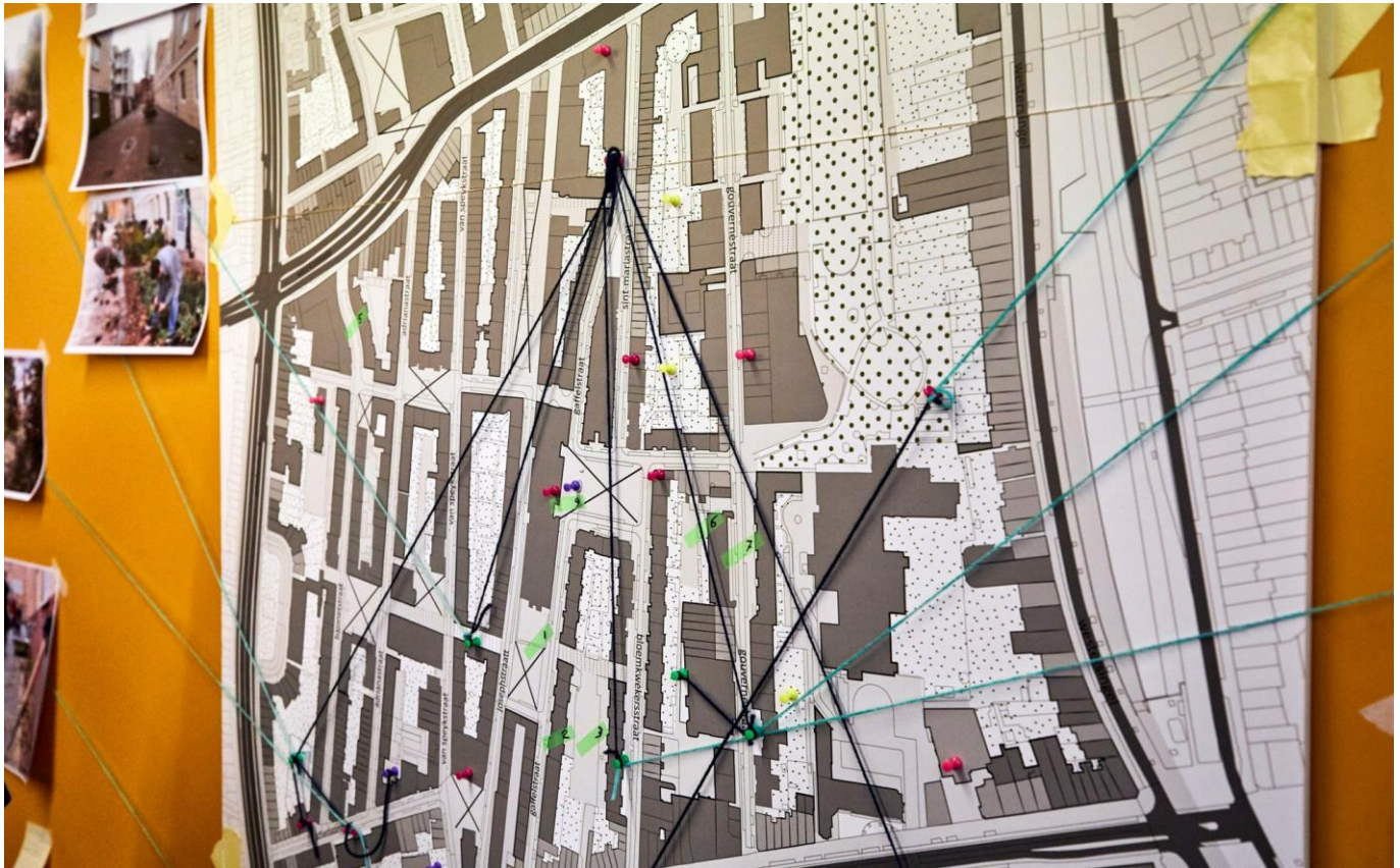
De Aktiegroep het Oude Westen als spin in het web voor de vele bewonersinitiatieven in de wijk