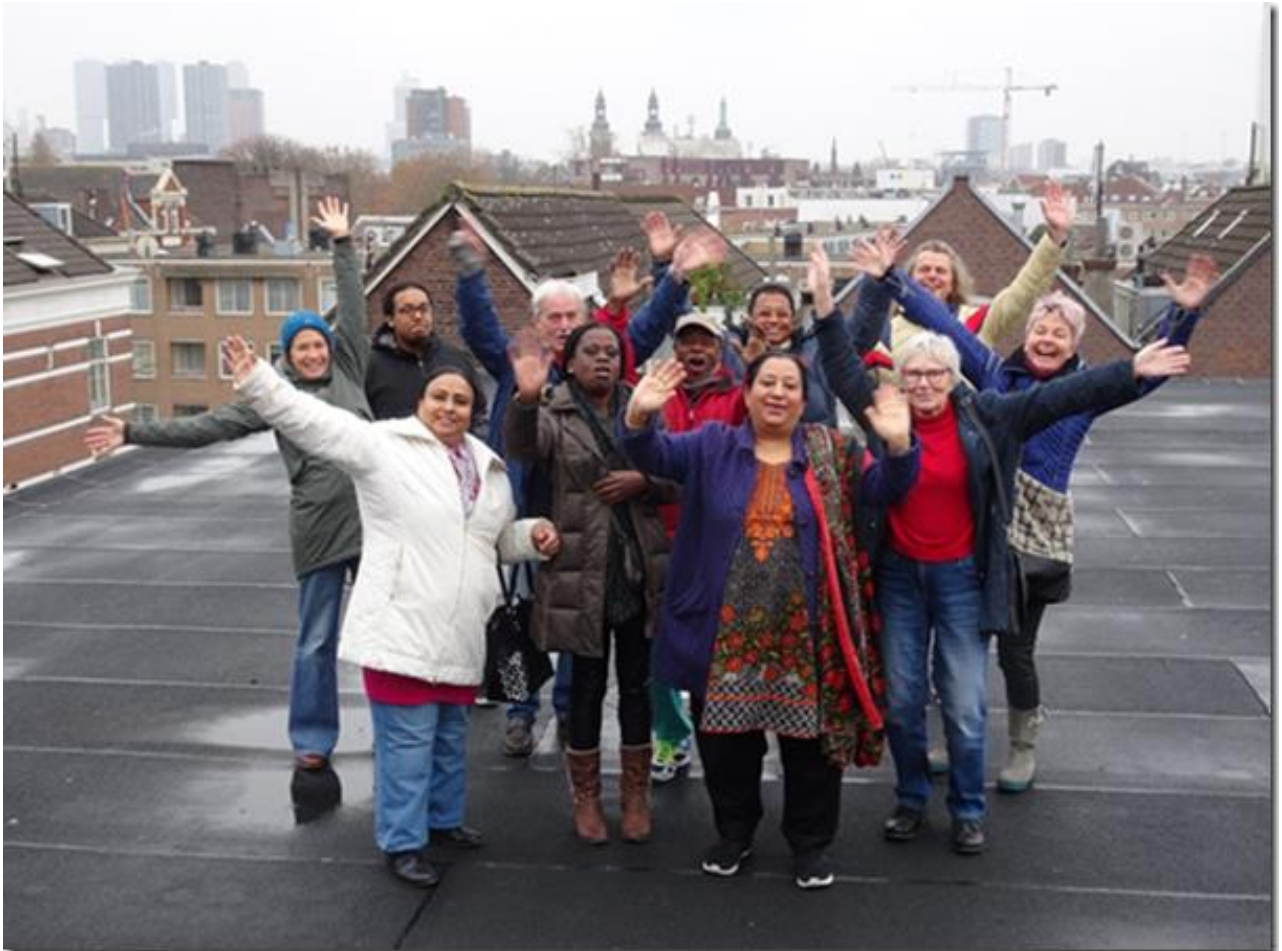
Het eerste dak waar collectieve zonnepanelen geplaatst gaan worden

gaan deze tien trainees samen met de Aktiegroep het Oude Westen een project ontwikkelen gericht op het verminderen van de energiearmoede in de wijk. Huishoudens die ten opzichte van hun inkomen een te hoge energierekening hebben en daardoor moeite hebben met het betalen van hun energierekening hebben te maken met energiearmoede.