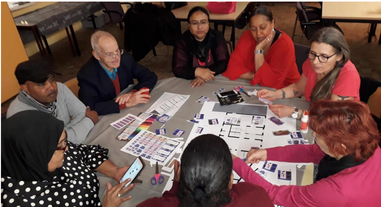
In groepjes dachten vrijwilligers na over een nieuwe indeling van het Wijkplein

In 2018 kwamen overdag gemiddeld 25 bewoners naar het Wijkplein, in totaal waren dat 5.625 mensen. Veertig procent van alle bewoners kwam binnen met een vraag, zorg, idee of formulier en is daarmee verder geholpen door vrijwilligers of een vakkracht (in totaal waren dat zo'n 2.250 bewoners). Deze tellingen zijn exclusief de bezoekers aan de avond- en weekendbijeenkomsten en exclusief de jongeren van de Huiswerkklas.