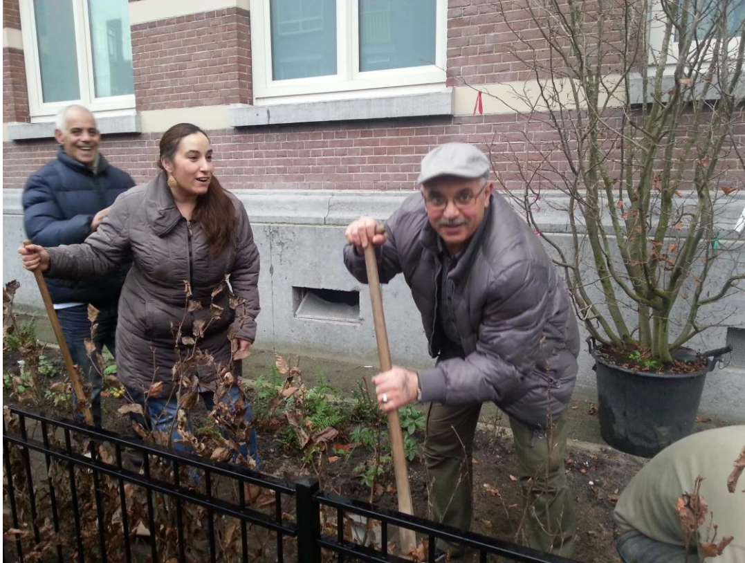
Samenwerken aan geveltuinen XXL