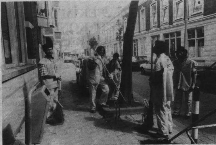
Topscore wil bewijzen dat drugsgebruikers normaal kunnen functioneren.