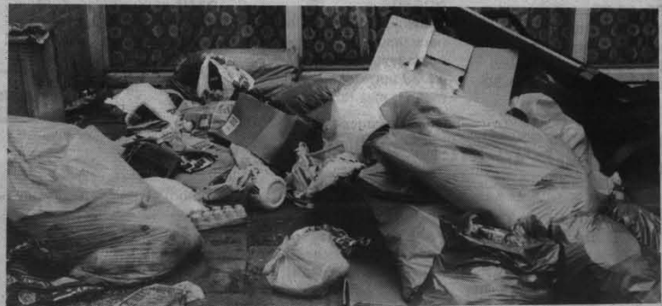
Vragen we niet om kakkerlakken ?