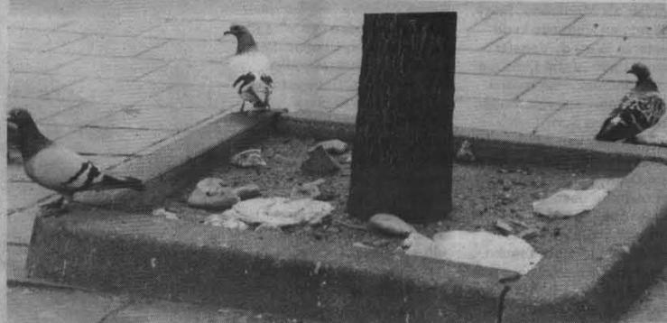
Overlast van ratten en duiven.