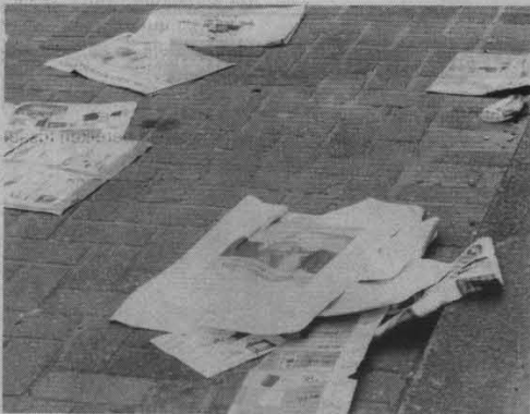
Folders en kranten die uitgelezen zijn,