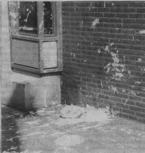
Verkeerd aangeboden huisvuil.

In de volgende buurkranten meer hierover, blijf het volgen en doe mee.