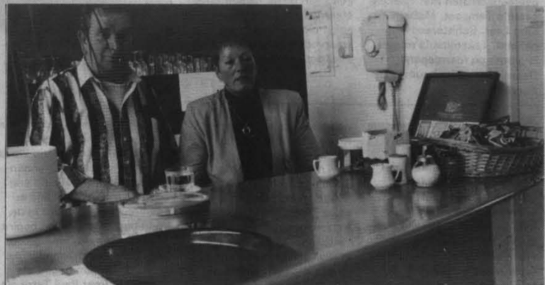
Vermoeid kijken ze naar de klanten.

Voor meer informatie kunt u contact opnemen met: Wijnje, 436 75 65