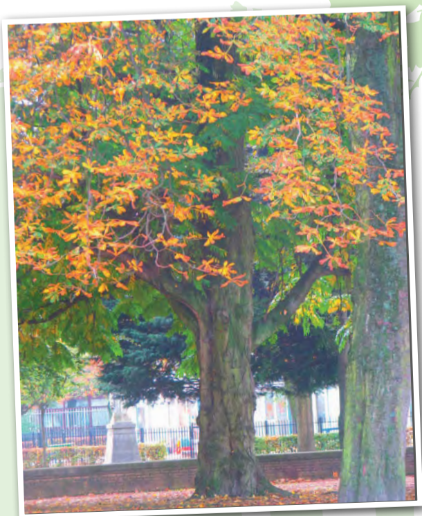
Vooroorlogse bomen in het Wijkpark

In het Oude Westen staan niet veel oorspronkelijke bomen meer, het gevolg van het bombardement, de bommenkap voor brand- en timmerhout tijdens de Hongerwinter en de stadsvernieuwing in de jaren tachtig. De oudste is de Breytenbachboom (genoemd naar de Zuid-Afrikaanse schrijver/dichter Breyten