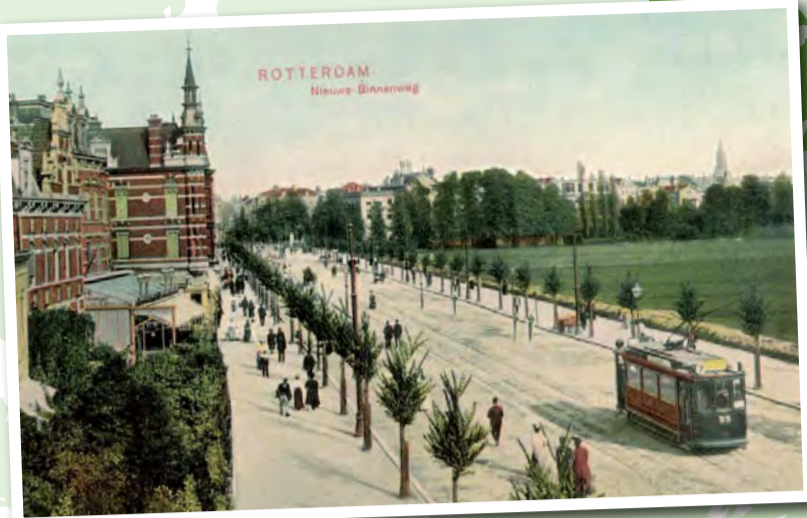
< Nieuwe Binnenweg vanaf de Bloemkwekerstraat tegenover het Land van Hoboken (ca. 1908)