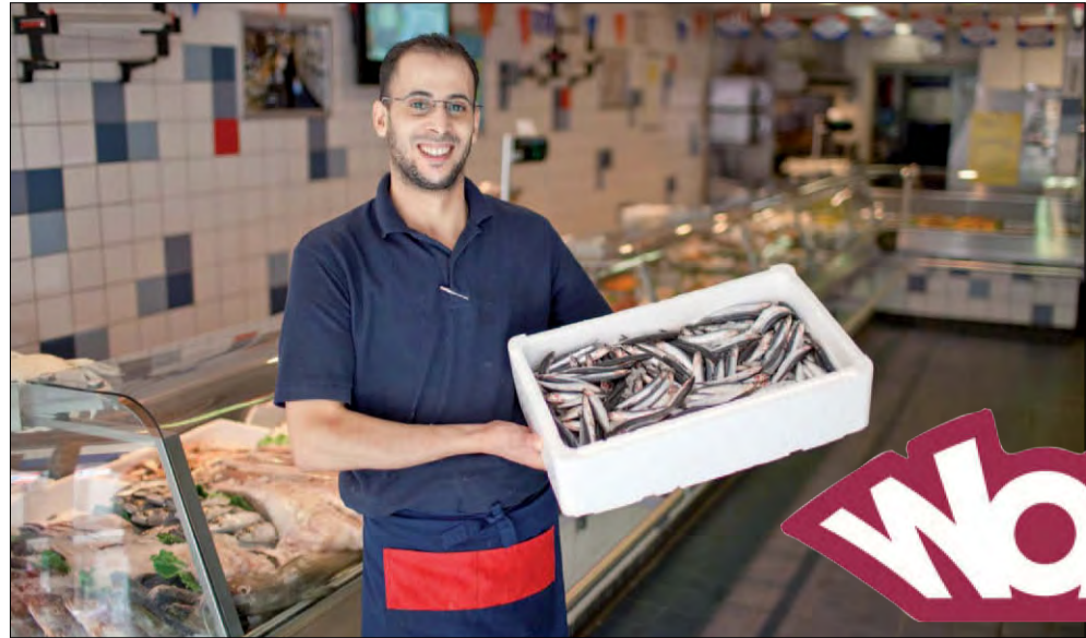
< Vishandel Andaluze aan de 1e Middellandstraat

Dat kan tot 1 december 2013. De mooiste inzendingen worden beloond met een verrassingsuur. Denk hierbij aan een etentje voor twee bij uw favoriete restaurant, een volle boodschappentas of een optreden op uw favoriete plek. Meer informatie vindt u ook op www.wow-rotterdam.nl