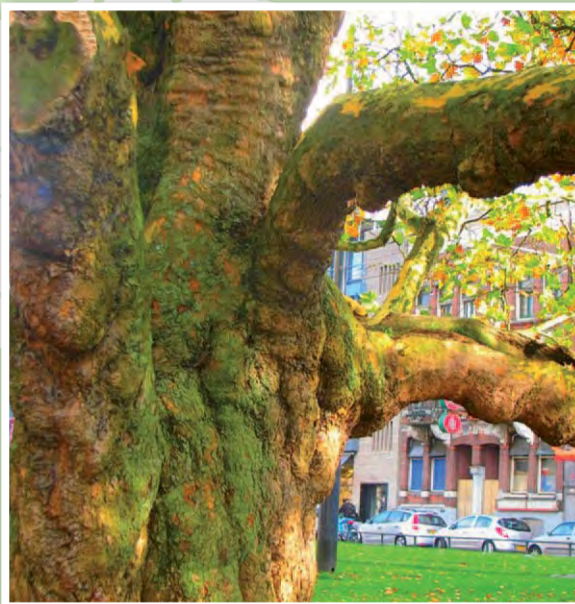
De Breytenbachboom aan de Westersingel

Breytenbach, die de boom in de jaren zeventig tijdens Poetry International bezocht), halverwege de Westersingel. De 20 meter hoge plataan, die vorig jaar een omtrek van 4,75 m had, is een keer verplaatst, heeft een ingrijpende verjongingskuur ondergaan en wordt met kunst- en vliegwerk staande gehouden. Maar hij is er nog, nu al 130 jaar, deze unieke boom, die zich tot jonge bomen in de wijk verhoudt als een authentieke stolpboerderij tot Vinex-woningen.