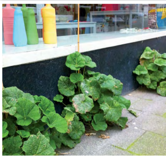
Stokroostegels bij het Centrum Beeldende Kunst