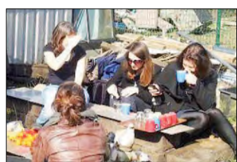
3 Bajonettuin gaat er komen!