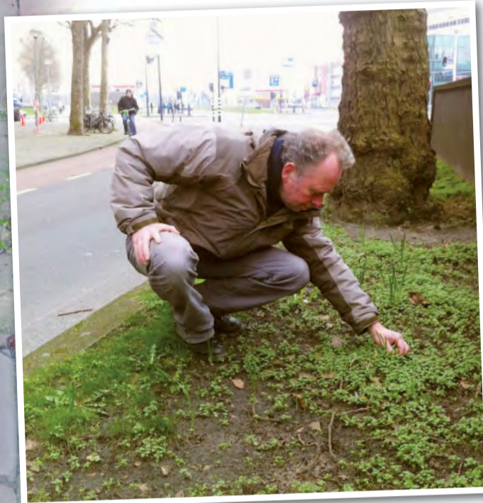
Han determineert wilde kiemplantjes aan de 's-Gravendijkwal