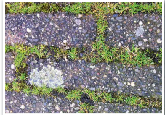
Straatgras en korstmoss in het Wijkpark