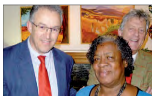
Burgemeesters op de koffie in de Leeuwenhoek