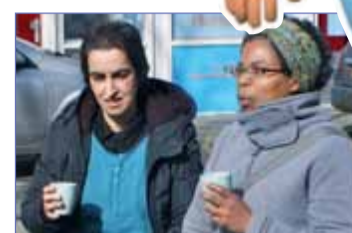
8 Koffie voor Geluk bij de St Mariastraat+Gaffelstraat