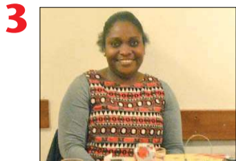
3 Wijkpastoraat DE UNION