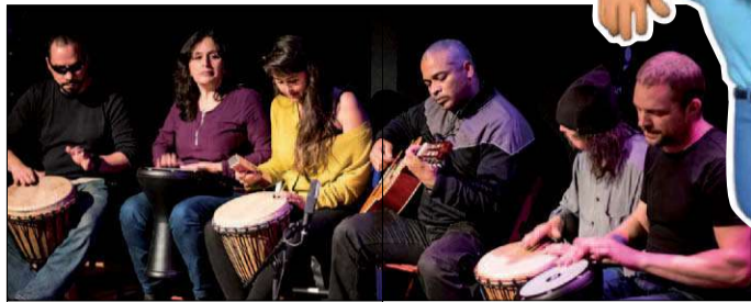
KUNST EN CULTUUR IN DE PAULUSKERK