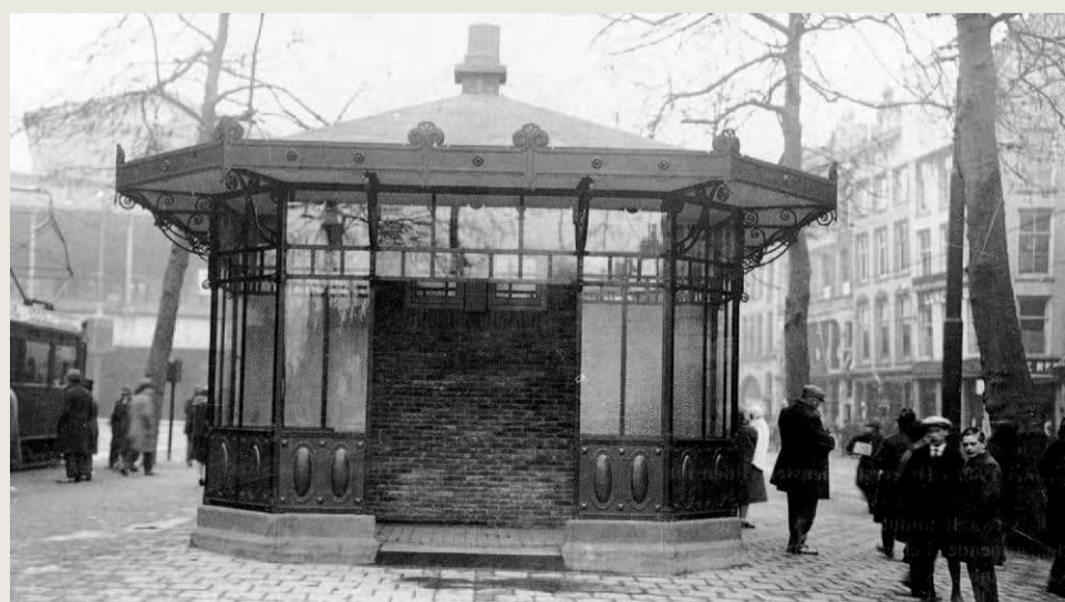
< Oude tramhuis op het Beursplein (1938)