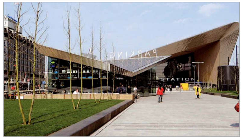
De ligging van de waterberging onder de voetgangerspromenade op het Kruisplein.

Een ander noemenswaardige ondergrondse waterberging ligt onder de garage van het museumpark of eerder onder de in- en uitrit van de garage. Dit bassin is in