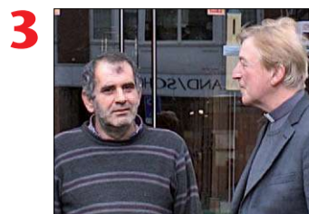
3 De Paradijkerk