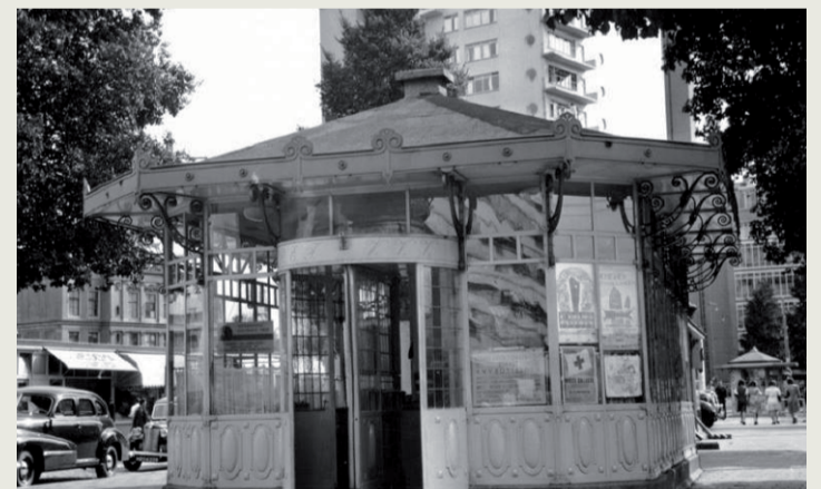
^ Oude tramhuis op de Coolingsel (1950)

Deze informatie is uitgezocht door Hans Kramer van Ons Rotterdam en was onlangs te vinden op de Rotterdamse Scheurmail. Op https://scheurmailrotterdam.nl kan je je aanmelden voor een gratis dagelijkse scheurmail met oud en nieuw nieuws over Rotterdam.