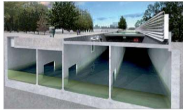
De ondergrondse waterberging in de Museumparkgarage (Afbelding: www.rotterdam.nl )

opslag. Op deze wijze voorkomt de gemeente dat kelders onderlopen en straten blank komen te staan door hevige regenbuien. De berging kan in totaal 2400 m 3 water (oftewel 2,4 miljoen liter) opvangen en bevindt zich onder de voetgangerspromenade die het stationsplein verbindt met het Kruisplein. Daarnaast biedt al het groen (en trouwens alle planten en bomen in de buitenruimte) op het Kruisplein het hemelwater de kans direct in de grond te zakken, zonder dat het rioolsysteem het verwerkt.