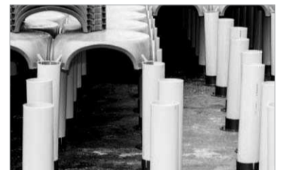
Aanleg waterberging Kruisplein

slag op de bodem van de berging is blijven liggen, verwijderd men met behulp van een vloedgolf.