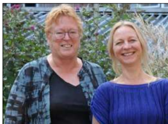
Toekomst van Belfleur verzekerd