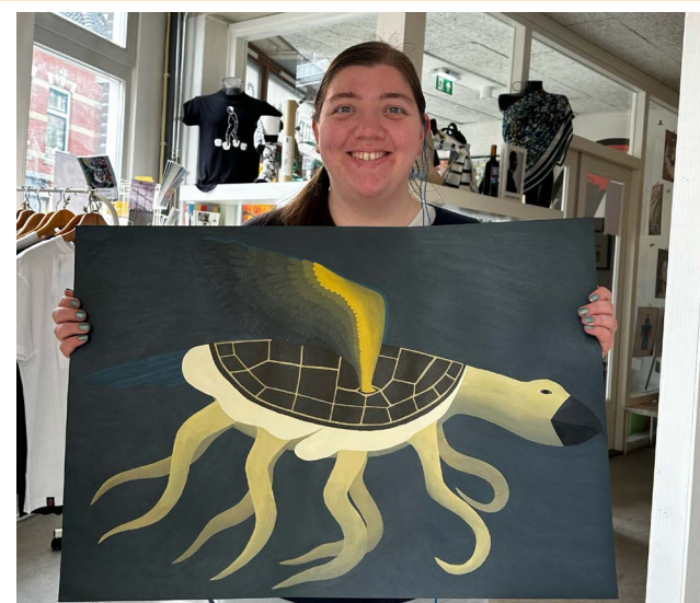
"vliegende schildpad" acrylverf op papier

Open maandag t/m zaterdag 13-17uur www.heren- plaats.nl