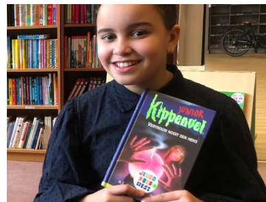
1+3 Jeugdbieb West