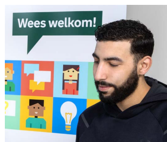
6 De Wijkhub