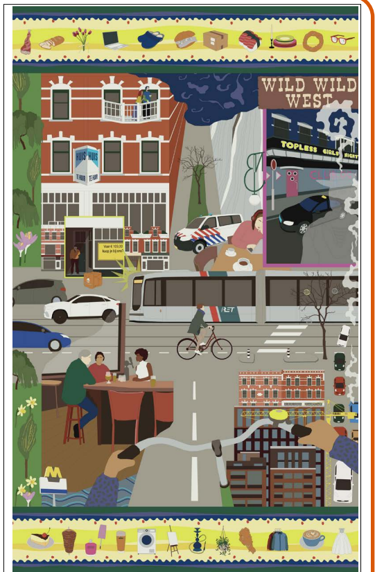
WILD WILD WEST. TOPLESS GOLD. Stories of a Street. Leyla Hapsaydir en Rebekka Schächer

Tentoonstelling: Current Traces #01 Street, Sounds, 5 hades t/m 18 augustus galerie OMI, Schietbaanstraat 21, openingstijden do - za 13:00 - 18:00. Rijnhoutpleinfestival: zaterdag 6 juli 2024