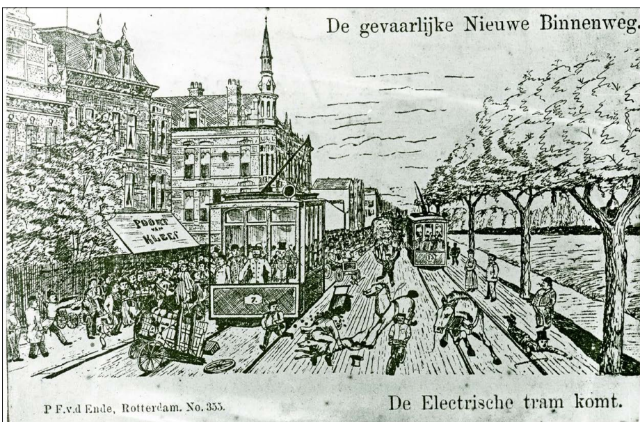
De gevaarlijke Nieuwe Binnenweg.