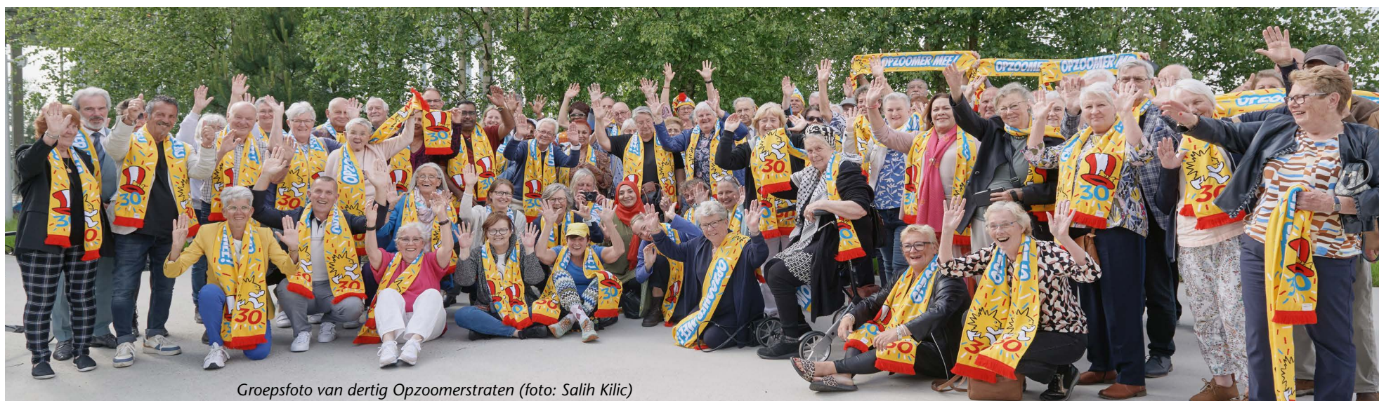
Groepsfoto van dertig Opzommerstraten