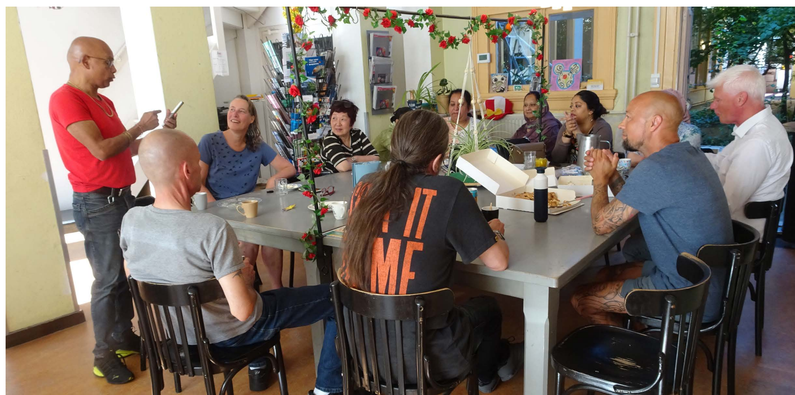
De vrijwilligers van de Aktiegroep namen afscheid van Deef met koffie/thee en gebak.

het verst. Het is een fijne plek. Het liefst wil ik in het Oude Westen blijven. De wijk doet me denken aan het eiland Biak: de mensen hebben niks en geven je alles. Dat herken ik hier en dat is de reden dat deze wijk in mijn hart zit."