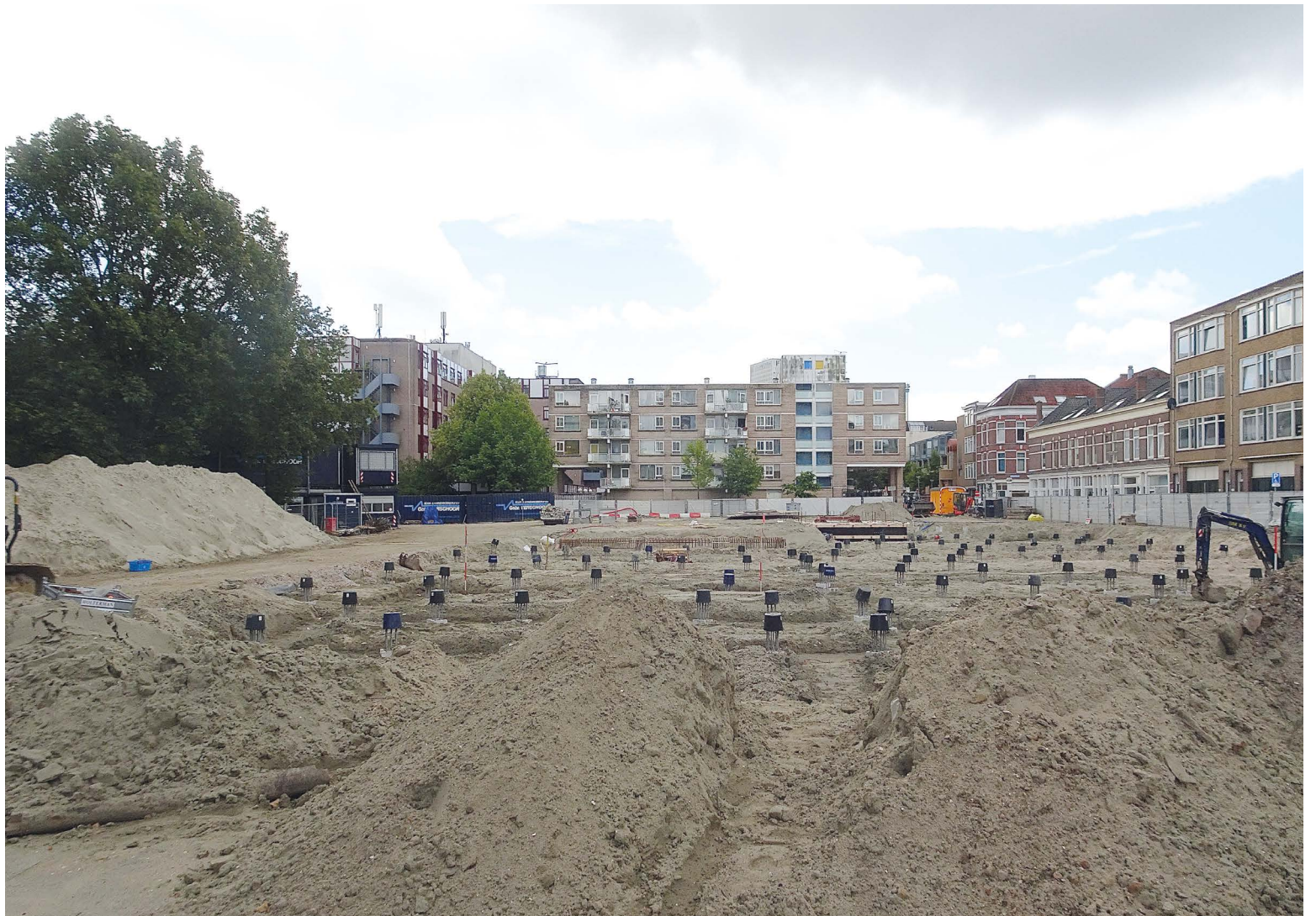
Over Odeon: Voorlopig wordt er nog niet gebouwd. Eerst moet er nog zand gestort worden.