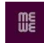
Communicatie en marketingbureau