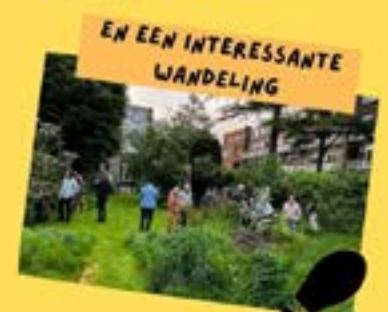
EN EEN INTERESSANTE WANDELING